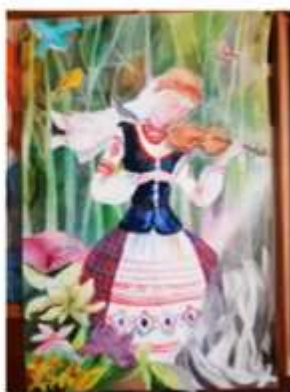
«Мяроўная музыка Беларусі»

На уроках безотметочного обучения по изобразительному искусству и факультативных занятиях безусловно нужна мотивация, создание ситуации успеха. Когда ребенок видит результат своего труда, интерес к этому предмету возрастает, самооценка повышается. И это стимулирует к дальнейшему развитию. Поэтому участие в конкурсах, выставках, творческих проектах просто необходимо. В этих проектах могут быть задействованы учащиеся разных возрастных категорий: и второй, и