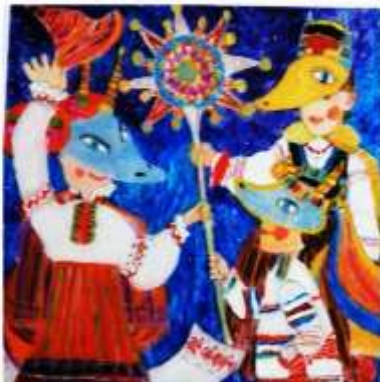
Роспись на стекле «Калезы»

Большое внимание уделяется выбору материала. Учащиеся, выполняя свои тематические задания, осваивают различные художественные техники. Например, лепка куклы в национальном костюме из пластилина на основе все той же пластиковой бутылки очень легка и проста в выполнении. Также применяется часто роспись