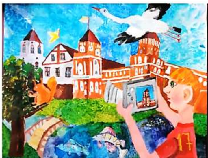
«Беларусь – мая радзіма»

С незапамятных времен культура Беларуси отражала не только быт, но и внутренний мир белорусов. Во время работы над этим проектом, учащиеся превратились в настоящих исследователей. Создавая свои работы, ребята погружались и очень тщательно изучали тему, которую выбирали.