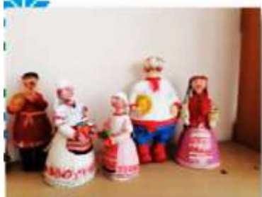
Лепка «Национальные костюмы»