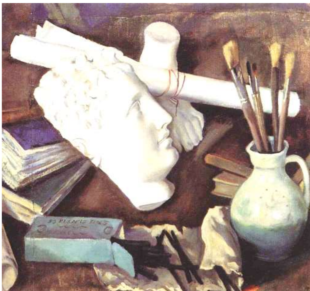
Материалы областного семинара